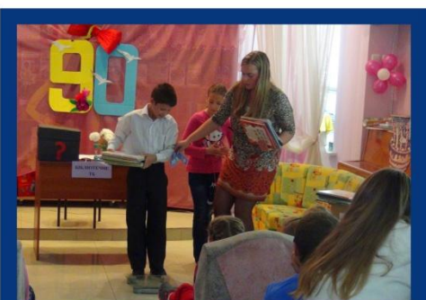
Діти зважують "знання"

А на десерт наші гості взяли участь у програмі «БібліоСмак», під час якої шеф-кухар з Франції поділився рецептом святкового торта, який всі разом відгадали, а що відгадали - те і скуштували!