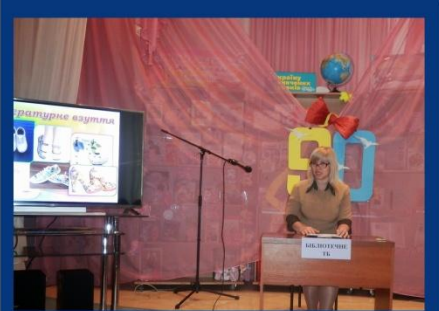
В ефірі звучать "Ювілейні новини"

Святкова Програма сектора абонементів до 90-річчя ХОБД ім. Дніпрової Чайки пройшла цього разу у формі читачьких ТВ-мандрів. 5 жовтня у стінах бібліотеки зібралося чимало шанувальників та поціновувачів різноманітних реаліті-шоу та телепрограм.