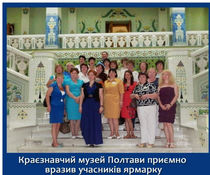
Краєзнавчий музей Полтави приємно вразив учасників ярмарку