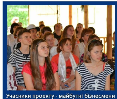
Учасники проекту - майбутні бізнесмени

На базі «Зелених хуторів Таврії» учасники-фіналісти виконували серію завдань, аби віднайти сховані кмітливим ведучим свята – книжковим героєм і «великим комбінатором» Остапом Бендером – призи. Вони відвідали дачу Елочки Людожерки, світлицю Солохи, Чортів хутір, обійстя Кота Базиліо та садок Лисиці Аліси. Пригода завершилася благополучно – після дуельної гри у шахи Остап повернув заслужені призи, які і були урочисто вручені переможцям.