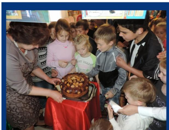
Святковий пиріг - подарунок читачам від дитектора типографії "Стар"