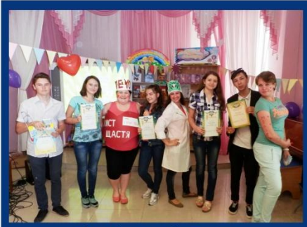
Фіналісти веб-квесту "Бібліотечний Меді@-PROстір"

У кінці дійства "перереформатовані" віруси привітали усіх зі святом, пригостили дітей смачними прохолодними напоями та подарували добрий настрій - чарівні повітряні кульки.