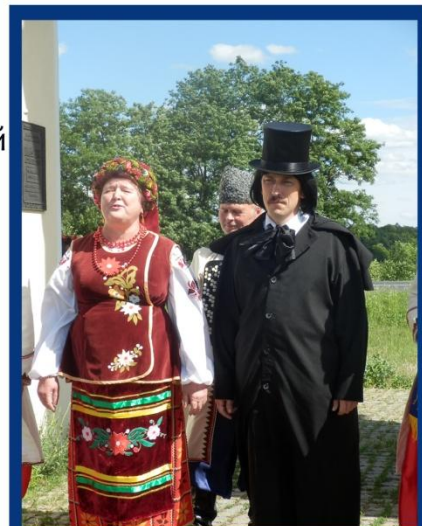
Микола Гоголь особисто вітає гостей у Диканьці

"БібліоКре@тив-2014" справив на усіх його учасників глибоке враження, надихнув на творчу роботу, - і передав естафету професійної творчості до Миколаївської області, де має відбутися Ярмарок 2015 року.