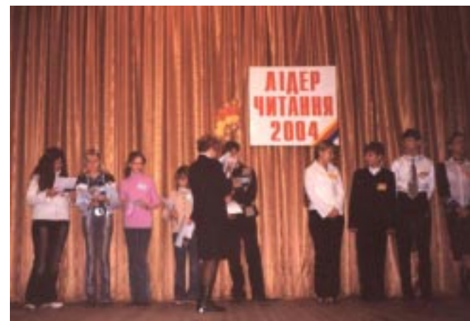
Претенденты на звання міжобласного лідера читання року на сцені.

Гермиона приглашает на сцену по очереди участников из каждой команды - один херсонец, затем - участник из Николаева, и т.д. Ребята читают домашние задания и уходят со сцены. Гермiona все время остается на сцене и комментирует в конце каждое выступление. Появляется ведущая.