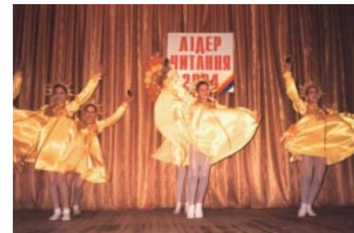
Святкового настрою учасникам і вболівальникам додавали дитячі танцювальні колективи Херсона.