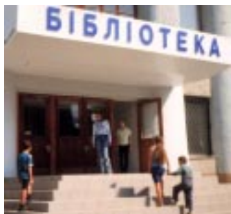
Херсонська обласна бібліотека для дітей